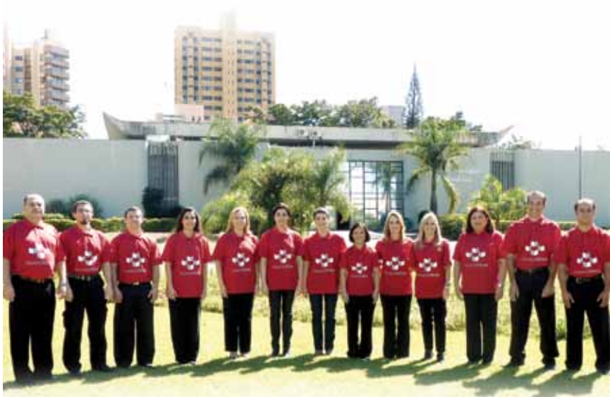
GRUPO VOCAL DA CÂMARA MUNICIPAL DE LONDRINA