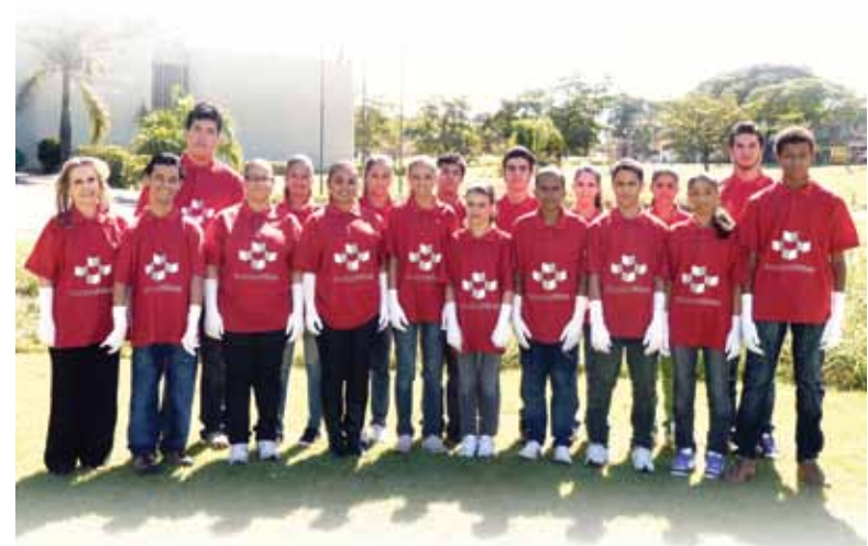
CORAL VOZES DO INSTITUTO LONDRINENSE DE EDUCAÇÃO DE SURDOS (ILES)