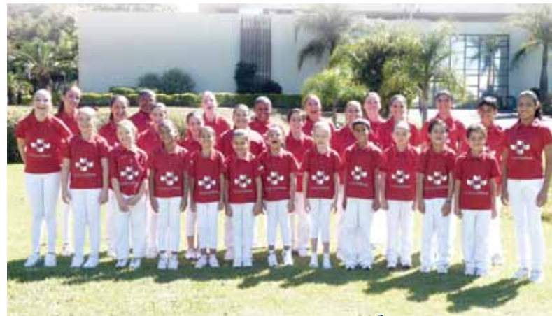
CORO INFANTO-JUVENIL DA VIAÇÃO GARCIA